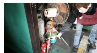
消火器取扱い訓練

評価：・消火器の場所の再認識ができた。 ・使用期限が過ぎたものがあつたため、入れ替えを実施する。