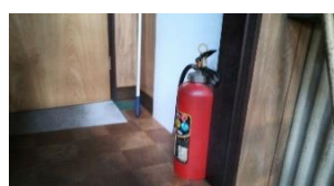
消火器の位置確認