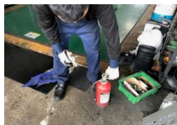
消火器取扱い訓練