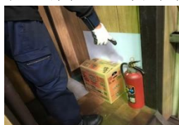
消火器の位置確認