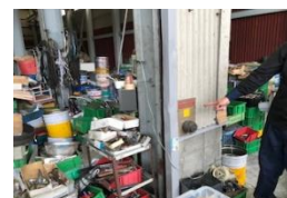
緊急時のシャッター開閉の確認

評価：・消火器の場所の再認識ができた。 ・消火器は使用期限内であることを確認した。